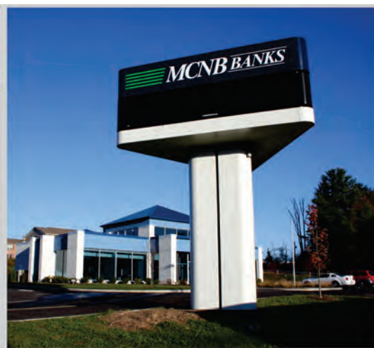
CorelDRAW 帮助 Identity America 的设计人员创作出可以在整个项目中 (从设计阶段一直到物理实施) 重复使用的架构图和示意图。