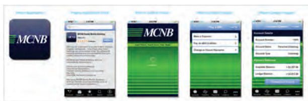
MCNB 银行的新 iPhone 和移动银行应用程序由 Identity America 负责设计。

“我们的最终目的是通过使用 CorelDRAW 帮助客户获得精美的门面，” Neal 解释道。“我们想让客户对其形象和标识充满自豪。”